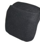
7,6 x 7,6

Verkrijgbaar in 2 verschillende maten; klein model 7,6 x 7,6 cm en groot model 7,6 x 12,7 cm