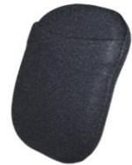
7,6 x 12,7